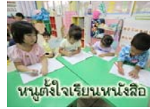
หลักสูตรวิชาการ