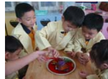
หลักสูตร Little Lab Junior