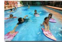
หลักสูตรว่ายน้ำ