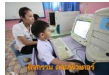
หลักสูตรคอมพิวเตอร์