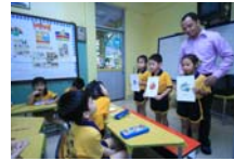
หลักสูตร Easy English