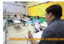
หลักสูตร Intensive